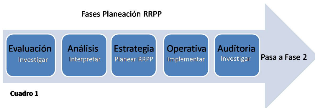
Figura 1. La Práctica

Cada público interno tiene necesidades de comunicación y de interacción que está alineada a sus expectativas, intereses y posición en la empresa. Tienen valores relacionales diferentes.